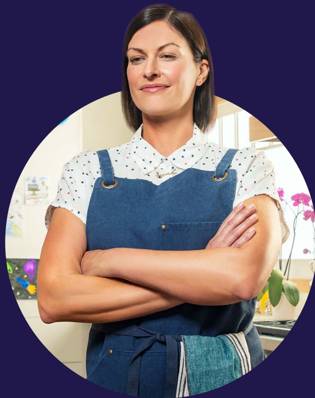
Retrato del actor