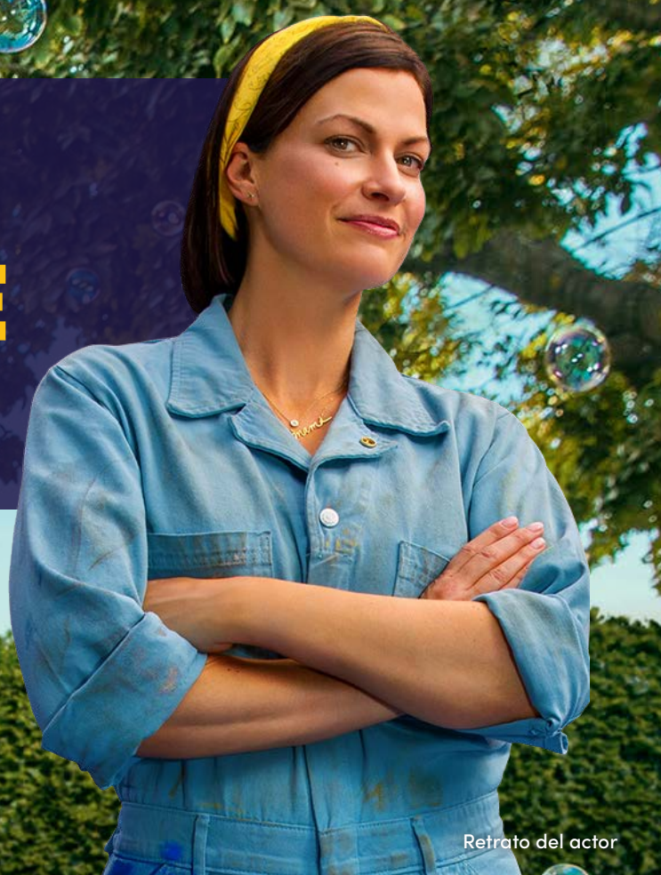
Retrato del actor

AUVELITY es el primer y único tratamiento oral para el TDM que se cree que actúa sobre los receptores de NMDA y sigma-1, entre otros. No está clara la forma exacta en que AUVELITY actúa para tratar la depresión.