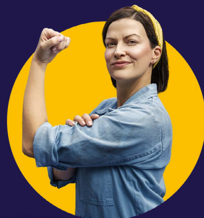
Retrato del actor

Los pacientes que reúnen los requisitos pueden pagar tan solo $10 por una receta de 30 o 90 días.†