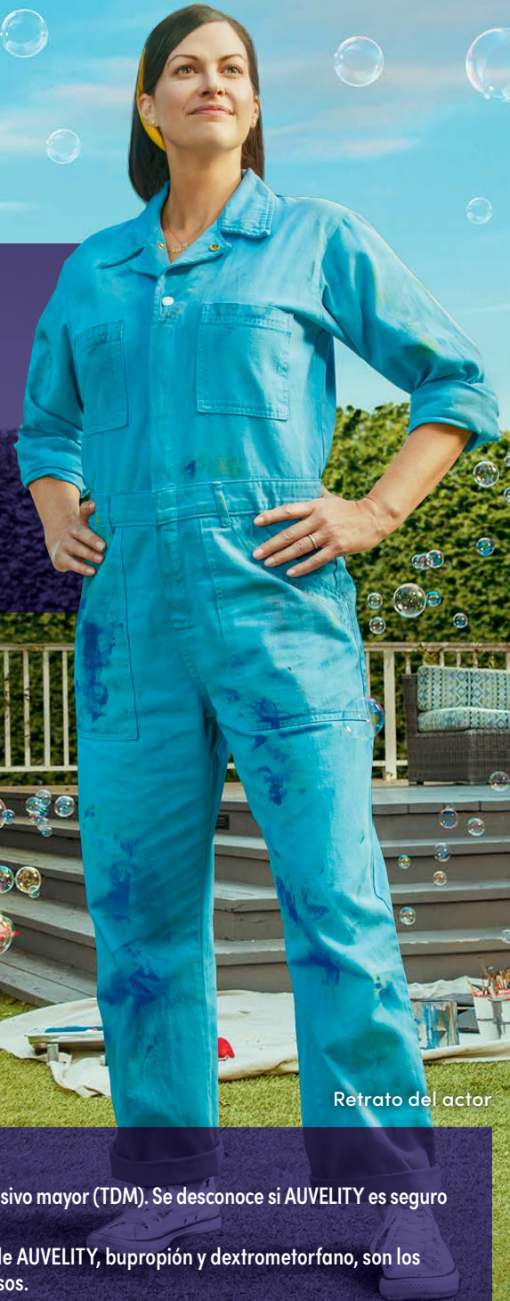
Retrato del actor