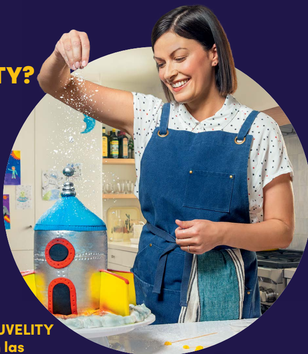
Retrato del actor

†Estudio de 609 adultos con TDM. Este estudio no se diseñó para evaluar la eficacia a largo plazo de AUVELITY. Los pacientes eran retirados del estudio al cabo de 6 semanas si no presentaban al menos una mejoría del 25 % en su puntuación de depresión. Se evaluó a 341 pacientes en el mes 9 y a 29 en el mes 12.